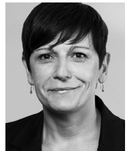
von Françoise Bassand

Konkret unterstützen wir die Sektionen in Migrationsfragen, bieten Vernetzungsmöglichkeiten an und veranstalten Anlässe zu aktuellen politischen Themen. Wir sind in Kontakt mit unseren europäischen sozialdemokratischen Schwesterparteien und sind zudem mit politischen Diaspora-Organisationen der wichtigen Migrationsgruppen vernetzt.