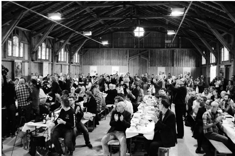
Delegiertenversammlung der Kantonalpartei vom 27. September 2014 in Winterthur

Die Jahresdelegiertenversammlung vom 26. Juni im Volkshaus war trotz gleichzeitig stattfindender Fussball-Weltmeisterschaft sehr gut besucht. Haupttraktandum war die Ver-