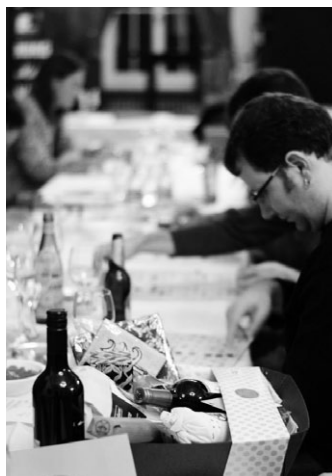
Lottoabend im Falcone, 28. November 2014