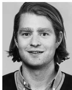
von Tobias Langenegger

Aus einem Industriequartier ist ein Trendquartier geworden. Diese Veränderungen versuchen wir zu begleiten und mitzugestalten, zum Beispiel mit unserer Petition zum Escher-Wyss-Platz («Vom Transitraum zu einem Ort des Verweilens»). Wir setzen uns ein für den Kreis 5 und eine starke SP – mit einem tollen, grossen Vorstand.