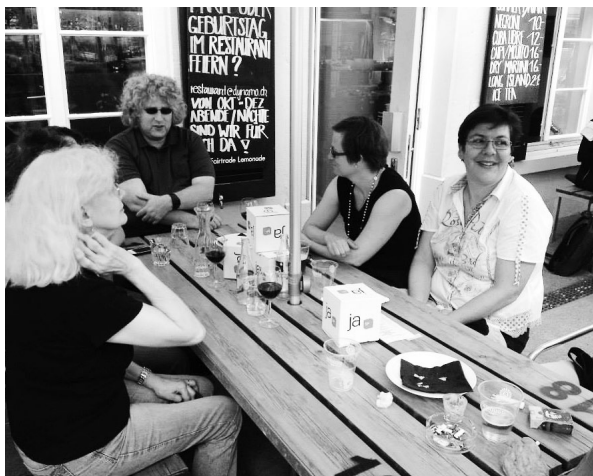
Sommerapéro der SP Stadt Zürich