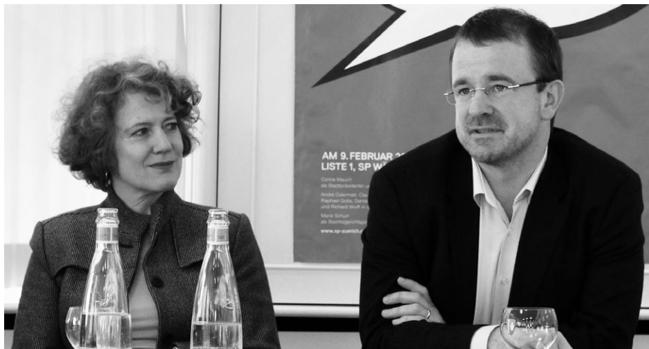
Stadtpräsidentin Corine Mauch und Stadtrat Raphael Golta

Bei der Kultur hat die Stadt ihre Pläne im Bereich der Literaturförderung überarbeitet. Der Strauhof bleibt als Ort für Ausstellungen erhalten, das Junge Literaturlabor Jull wird in der Bärengasse realisiert. Gleichzeitig kam der Le Corbusier-Pavillon im Seefeld wieder zur Stadt zurück und stand den Sommer über der Bevölkerung mit markant erweiterten Öffnungszeiten offen. Zum Jahresende hat das Baurekursgericht zudem den Rekurs gegen die Kunsthaus-Erweiterung abgewiesen. Dieses Grossprojekt kann endlich weitergeführt werden.